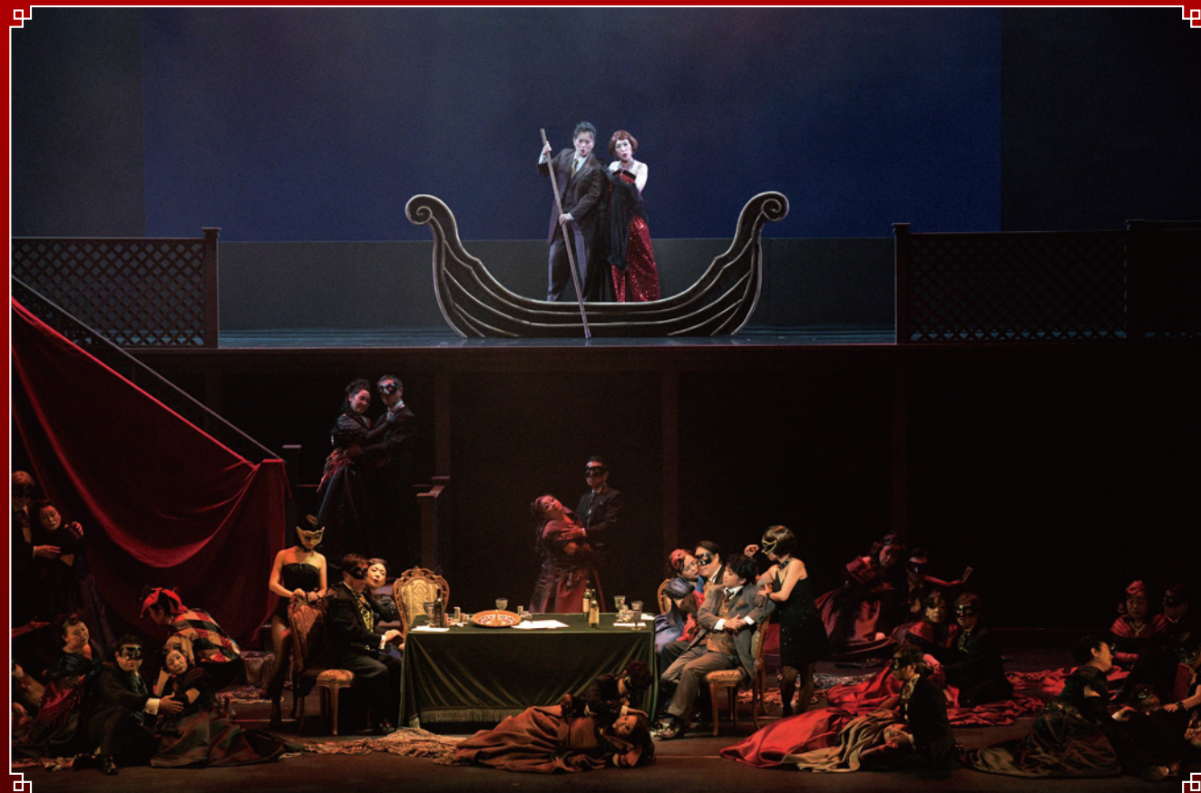
2019年10月5・6日 名古屋二期会本公演「ホフマン物語」より

地下鉄桜通線または名城線にて 「新瑞橋」(あらたまばし)駅を下車 8番出口を出て左へ50m