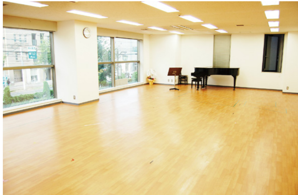
名古屋二期会オペラスタジオ