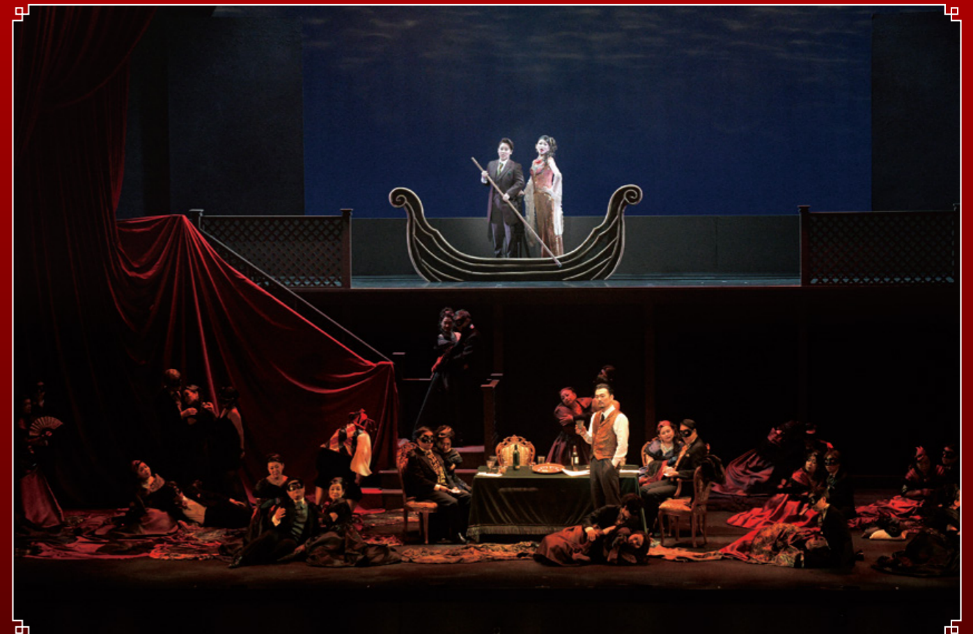
2019年10月5・6日 名古屋二期会本公演「ホフマン物語」より